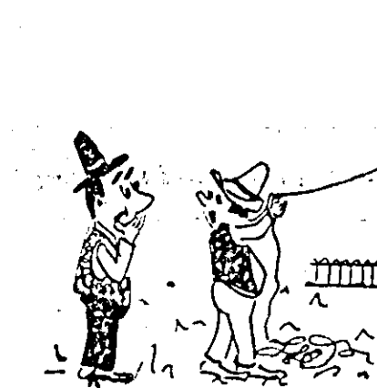
— Ce-ai făcut noi Ion? — Păi nu spuneați dumneae că trebuie să trimitem urgent adrese...