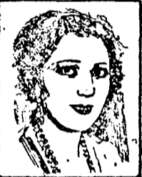
Mlle. RAQUEL MELLER du Palace