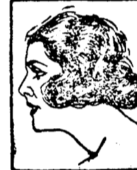
Mlle. ELVIRE POPESCO du Théâtre du Gymnase