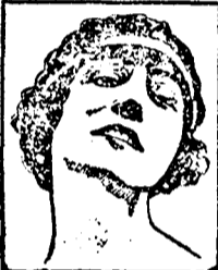
Mlle. CARLOTTA ZAMBELLI de l'Opéra