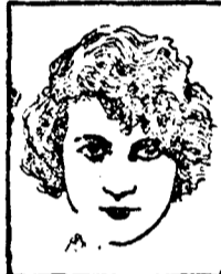
Mlle. HUGUETTE DUFLOS de la Comédie Française