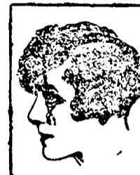
Mlle. GABY MORLAY du Théâtre Antoine