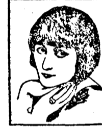
Mlle. NAPIERKOWSKA de l'Opéra Comique