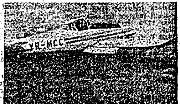
— Iar avionul este pregătit să facă și el tot a muncă agricolă pe ogoarele aceluiași cooperative — împrăștierea erbicidului.