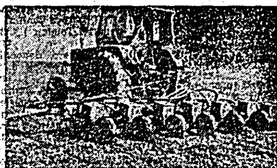
Mecanizatorul Ioan Toth însemîntează porumbul pe ogoarele cooperativei agricole „Steagul roșu” din Pecica.