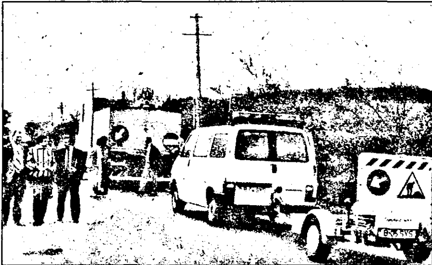
Demonstrație practică cu cele mai noi tehnici în domeniul drumurilor.

Toți participanții au fost prezenți la demonstrație și în ceea ce a privit starea de degradare a suprafeței, fiecare dintre ei au completat fișa proprie de măsurători, examinând personal tronsoanele selecționate pentru test, pe care le-au parcurs pe