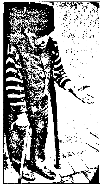
- Cum e viața la 80 de ani? Cum să fie taică, grea și, din păcate, legată doar c-o ață.

Credeam că e crud s-o determinăm să vorbească despre ea în acele clipe. I-am spus-o. Mi-a răspuns că-mi fac probleme inutile. În situația ei, cea mai mare cruzime nu e faptul că va muri, ci așteptarea. Cumpănită așteptare a ultimului ceas. L-ar vrea aproape. Durerile-i sunt prea mari pentru a le mai putea