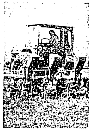
În raza S.M.A. Sîntleani, odată cu prășitul porumbului, mecanizatorii aplică și îngrășămintele chimice.