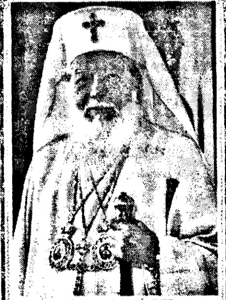
PREA FERICITUL PĂRINTE TEOCTIST PATRIARHUL BISERICII ORTODOXE ROMÂNE

Prea Fericitul Teoctist, Patriarhul Bisericii Ortodoxe Române s-a născut la 7 februarie 1915, în satul Tocileni (jud. Botoșani), ca al zecelea dintre cei unsprezece copii a familiei Arăpașu. A primit la botez numele de Toader. În 1928 a intrat, ca frate, la schitul Sihăstria Voronei. În anul 1935 a deșus voturile monahale, la Mănăstirea Bistrița-Neamț, primind numele Teoctist. În 1945 va fi licențiat în Teologie, cu calificativul „Magna cum laude”, fiind transferat ca preot la Catedrala Mitropolitană din Iași. Între 1946 - 1947 urmează cursurile Facultății de Litere și Filosofie din Iași, iar în 1950 este ales - la propunerea Patriarhului Justinian - Episcop Vicar al Patriarhiei. La 28 iulie 1962 a fost ales în postul de Episcop al Aradului, Ienopoliei și Hălmeagului. Ca episcop al Aradului a avut sub jurisdicție vicariatul de la Gyula și două protopopiate din Banatul Sărbesc. În 1973 a fost ales Arhiepiscop al Craiovei și Mitropolit al Olteniei. În 1977 a fost ales Mitropolit al Moldovei și Sucevei. Din 1986, Colegiul Electoral Bisericesc l-a ales în demnitatea de Patriarh al Bisericii Ortodoxe Române.