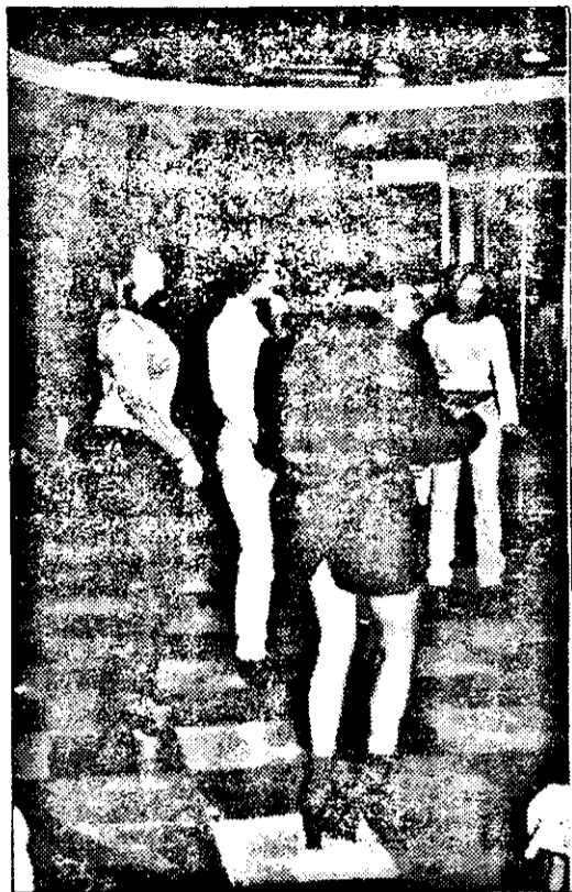
La „Astoria Night” fetele au început dansul...

Dar ținta noastră n-a fost hotelul, ci discoteca. Unde, după ce intrăm, încă ne mai îndoim dacă am nimerit chiar într-o sală de dans. De