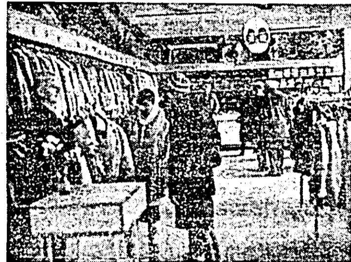
Aspect din magazinul de confecții pentru copii, „Prichindel” din zona A. Vlaicu.