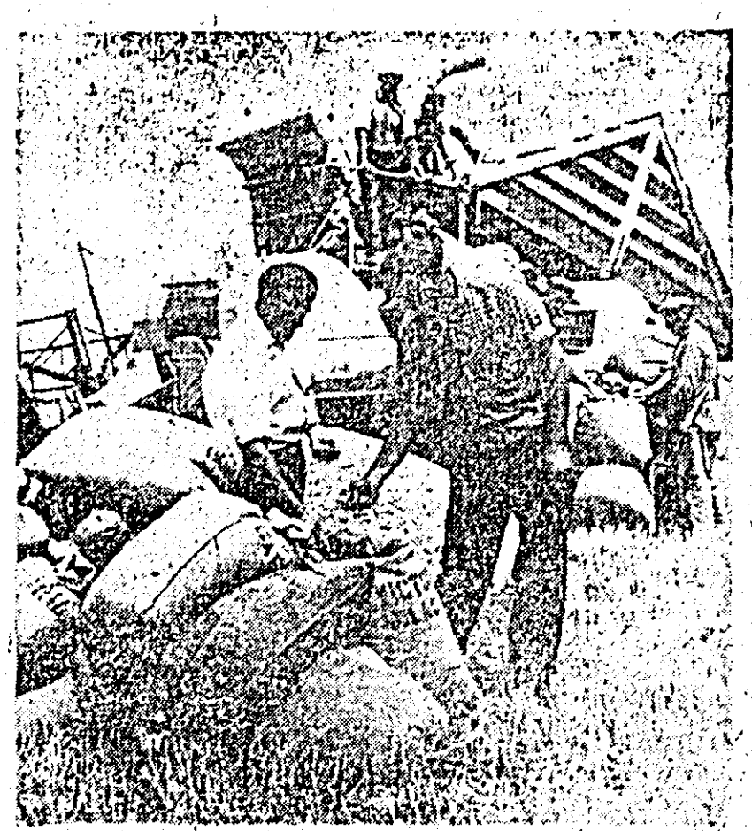
În cîmpa ploii care îngreunează mult recoltatul, la cooperativa agricolă de producție „Victoria” din Nădlac, recolta bogată de grâu se adună cu grijă pentru a nu se pierde nici un bob.