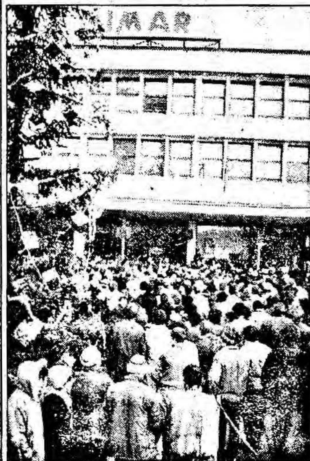
Ieri dimineață, circa 1000 de muncitori de la SC IMAR Arad (fostul CPL) au ieșit în stradă, mai exact în fața pavilionului administrativ. A fost o manifestare a disperării. Ce anume i-a determinat să lase lucrul și să recurgă la acest gest? Pag. 2