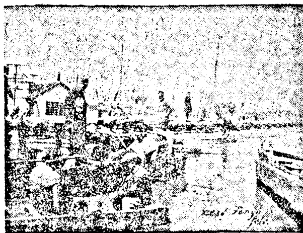
MENTÉSI MUNKÁLATOK MIKALAKÁN