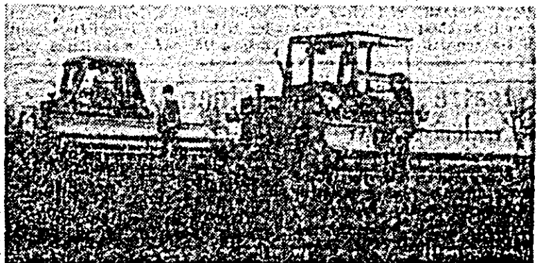
Mecanizatorii și cooperatorii din Vinga în plină acțiune la semănatul trifoiului.