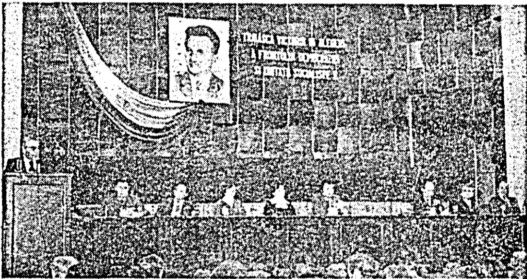
Aspect din timpul desfășurării adunării cetățenești de la Palatul cultural.