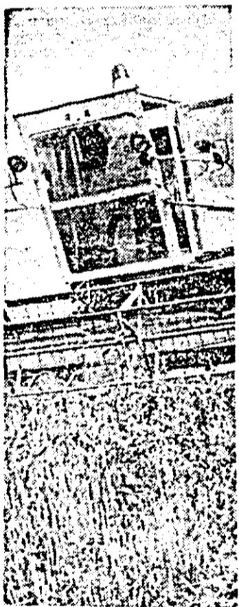
Pașină realizată de T. PETRUȚI

● Urmărit coordonatele noii revoluții agrare, agricultura arădeană va face în acest cincinal un important salt calitativ în sensul creșterii producției globale agricole, în raport cu cea din cincinalul precedent, de circa 30 la sută. ● Producțiile medii la hectar în acest cincinal, comparativ cu cele din cincinalul precedent, vor spori astfel: grâu și secară — cu 22,8 la sută, orz-orzoaică — 15,1 la sută, porumb — 7,6 la sută, sfeclă de zahăr — 49,5 la sută, legume — 68,3 la sută. ● Importante creșteri vor înregistra și efectivele de animale ale județului. La bovine sporul va fi de peste 50 la sută, la porcine 9 la sută, ovine — circa 40 la sută, păsări — 44 la sută. ● Corespunzător vor spori și producțiile rezultate din sectorul zootehnic. Producția de carne va crește cu peste 40 la sută, cea de lapte de vacă de 2,7 ori, producția de ouă — cu 57,6 la sută, iar cea de lînă cu circa 50 la sută.