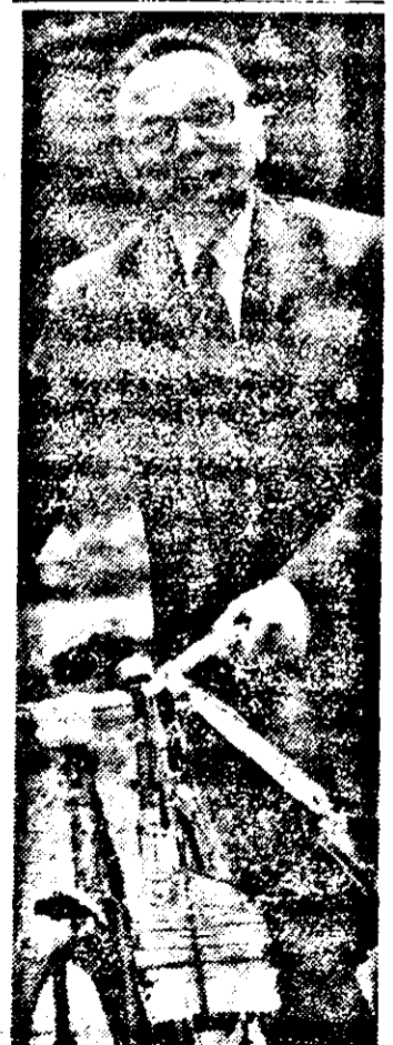
E vremea tezelor...

DACIA: Cei 7 din Teba. Orele: 9,30, 11,45, 14, 16, 18, 20. STUDIO: Pentru un pumn de ceapă. Orele: 9, 11, 13, 15, 17, 19. MUREŞUL: Jandarmul la plimbare. Orele: 9, 11, 13, 15, 17, 19. ARTA: Croaziera. Orele: 9, 11, 13, 15, 17, 19. PROGRESUL: Tik... tik... tik... Orele: 16, 18, 20. SOLIDARITATEA: Rochia albă de dantelă. Orele: 17, 19. GRĂDIŞTE: Ringul. Orele: 16, 18.