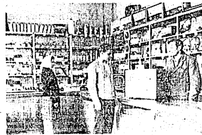
NĂDLAC. In magazinul cooperăției de consum.

In acest an, rețeaua cooperăției de consum s-a îmbogățit cu noi construcții. Printre acestea se numără magazinele din Bicz, Rușcuțu, Jariștea, Amărăștii de Jos și Brezna, complexe comerciale moderne la Vălenii de Munte (cu o suprafață de 1 272 mp) și Lehlu (cu peste 1 400 mp). Pentru păstrarea și depozitarea cantităților sporite de mărfuri cerute la săte au fost ridicate la Marghala, Ghergani și Vatra Dornei depozite cu o suprafață totală de peste 4 000 mp. Pe linia îmbunătățirii servitiilor populației în 9 comune au fost date în funcțiune brutării