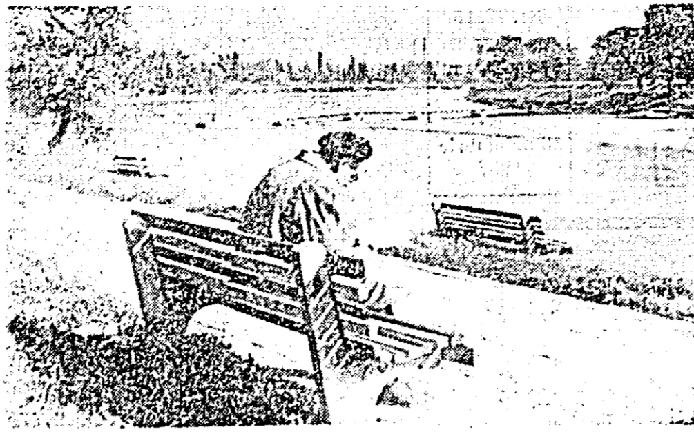
Zile însorite de toamnă. O lectură pe malul Mureșului e deosebit de reconfortantă.

In cadrul laboratorului de psihologie a gândirii și limbajului de la Universitatea din Cluj a fost conceput și realizat un aparat electronic denumit „Electroscriptograf” care, cuplat cu un electroencefalograf, permite studierea complexă a fenomenelor care au loc în timpul scrierii. Experimentele de până acum au dus la câteva constatări deosebite de interesante. Biocurenții de la nivelul musculaturii orale (buze, limbă) apar, de pildă, cu o anumită întârziere față de activitatea grafică propriu-zisă și persistă în tot timpul scrierii. Limbajul intern anticipă așadar exprimarea în scris. Pe parcursul scrierii, limbajul intern este permanent prezent și controlează activitatea grafică. Cercetătorii clujeni au observat, de asemenea, că anticiparea mintală a activității grafice, pe planul limbajului intern, declanșează, înaintea de începerea actului scrierii, potențiale bioelectrice la nivelul musculaturii minii dreptului.