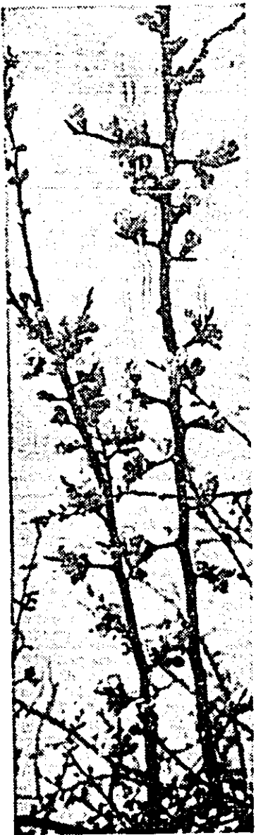
Au înflorit cașii...