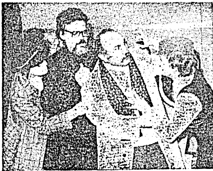
Moment din spectacolul „Cursa de Viena” de Rodica Ojog-Brașoveanu pe scena Teatrului de stat Arad.