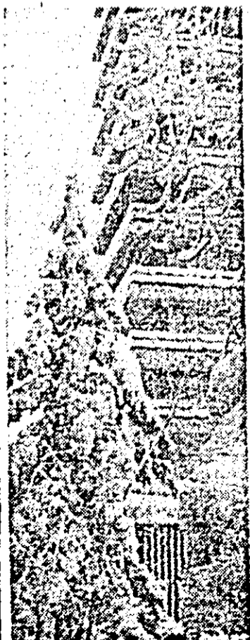
Ilustrată de sezon.