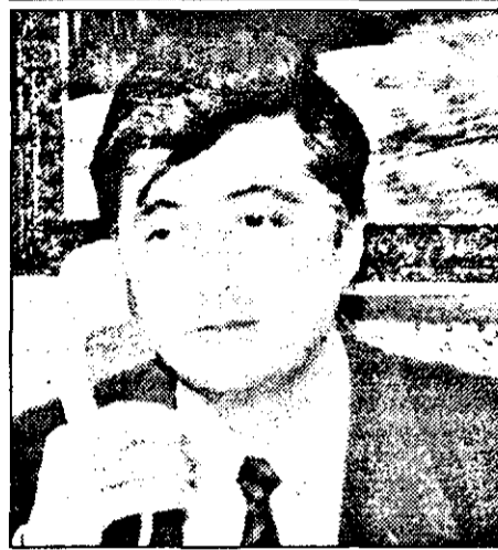
20 de cerei de repartitii de grâu. Vin oamenii din județele Hunedoara, Alba, Caraș - Severin și bineînțeles de la noi din Arad.

- Grâul pe care îl vindeți este din recolta anului 1996?