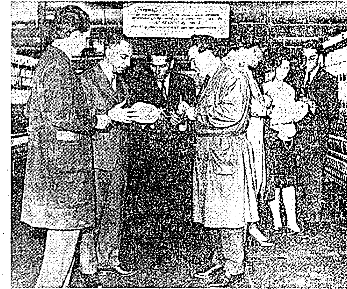
ÎN CLIȘEU: În secția filatură a uzinelor „30 Decembrie” vizitatorii discută despre rezistența firelor.