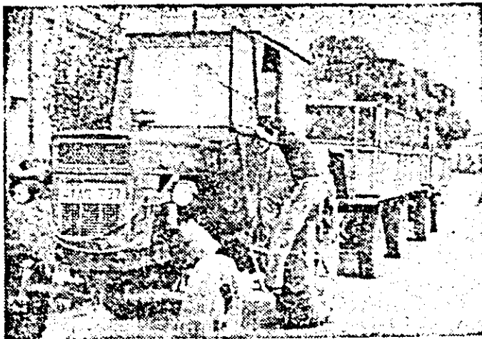
Tractoristul Petru Blaj, transportă două remorci de lîn de la ferma din Sîntea a I.A.S. Criș lînă bon de transport. Oare, de la această fermă poate să ia furaje care cum poltește?

Iată de ce. Înainte ca milizia să intervină pentru depistarea