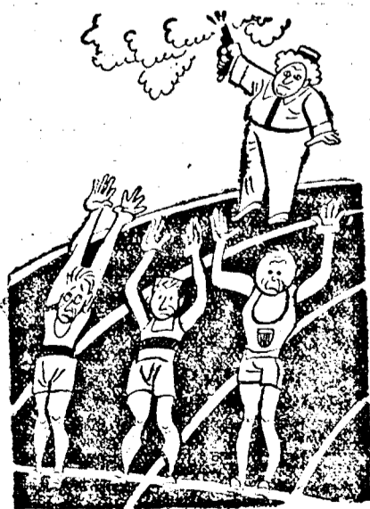
Startjelzés hatása Chicagóban...

Miért késlekedik? Előbb-utóbb ugyanis Toga-tablettát kell vásárolnia, ha nemcsak a fájdalmakat csillapítani, hanem egészségét s ezzel egyidejűleg életkedvét igazán visszanyerni akarja. Toga gyorsan és biztosan gyógyítja a rheumát, köszvényt, ülőidegzsábat, gripát, idegfájdalmakat és főfájást, hülésos betegségeket. Toga legyen mindig kéznél! Gyógyszertárakban és drogériákban. Lei 12.—, 52.—, 130.—.