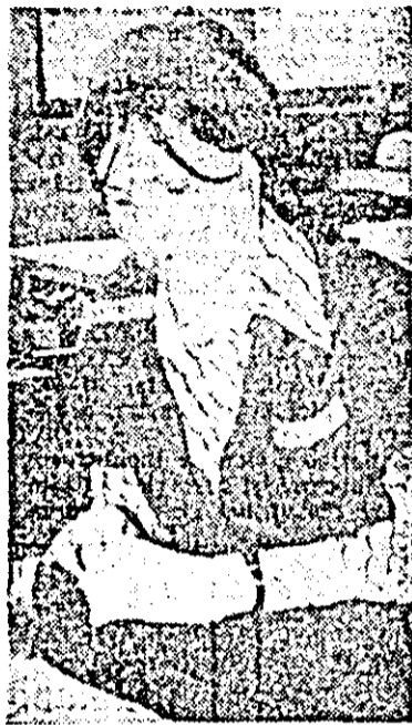
O tină harnică, apreciată pentru rezultatele frumoase obținute în producție: tucista Eugenia Bocăneli, de la întreprinderea de confecții.