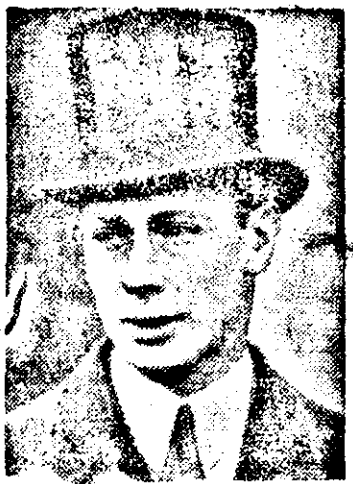
Bondon. Einer Privatmeldung zufolge wird General Franco nach Beendigung des Bürgerkrieges dem

Herzog von Windsor den spanischen Thron anbieten.