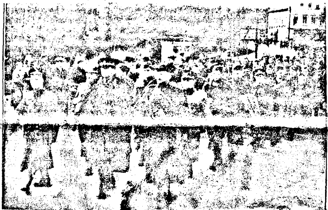
Tschechische Truppen beim Abmarsch aus dem subkarpaten Gebiete

Nach der Sitzung nahmen die beiden Delegationen auf Einladung des slowakischen Ministerpräsidenten, Dr. Josef Tiso, der in priesterlicher Abklischung erschienen war, in einem benachbarten Restaurant das Nachtmahl gemeinsam ein.