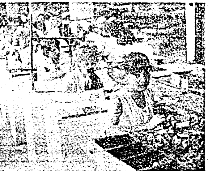
Întreprinderea de ceasornice „Victoria”. Aspect de muncă în secția montaj, unul dintre colectivele fruntașe în întrecerea socialistă.

— realizarea înainte de termen a programului de asimilări a produselor noi și modernizate. Față de cinci asimilări prevăzute pentru șapte luni, au fost realizate șapte. Printre cele mai semnificative produse remarcăm: transportorul cu lanțuri pentru distribuția hranei în fermele de păști, instalația de sortat tomate, agregatul de măcinat grosiere acționat de la priză de putere a tractoarelor, remorca-buncăr de 8 tone pentru transportat furaj concentrat etc. La produsele modernizate s-a acționat în special pentru reducerea consumului de metal și a celui energetic, concomitent cu îmbunătățirea parametrilor tehnico-funcționali. De pildă, prin modernizare, transportorul cu noduri pentru furajate hale de păști și porcine i-a fost redusă greutatea cu 120 kg, consumul energetic cu 10 la sută, iar productivitatea muncii a sporit cu 50 la sută. În cinstea zilei de 23 August colectivul întreprinderii va asimila, înainte de termen, un nou produs — autospeciala cu niveluri mobile pentru transportat animale.