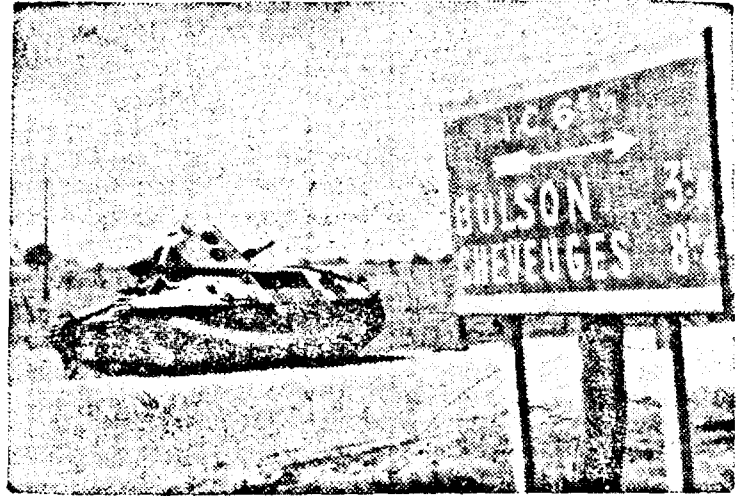
Blindatele germane înaintează vertiginos.