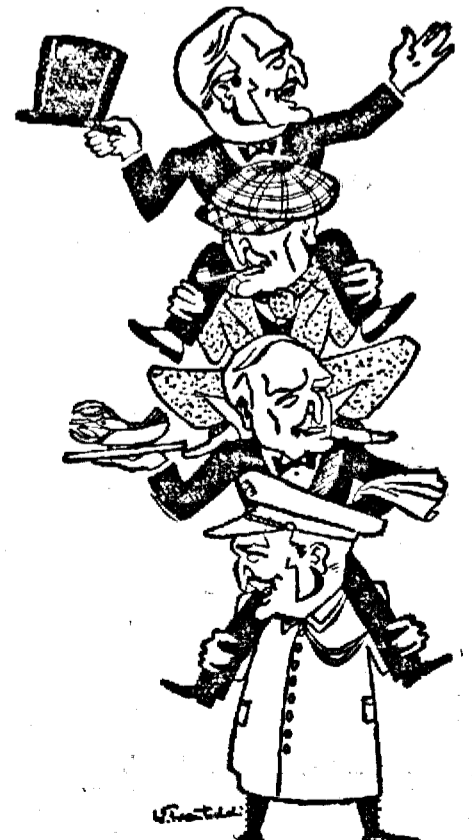
cu HANS ALBERS