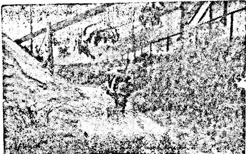
Frontul Francez. Corpul francez în patrulare.

Orientală, s'ar fi debarcat 2000 soldați englezi. Cantonamentele englezilor se află în satul Neuawy. Cu toate că faptul a fost ținut ascuns de guvernul Indiilor Olandeze, prezența trupelor britanice este cunoscută unor ofițeri japonezi,