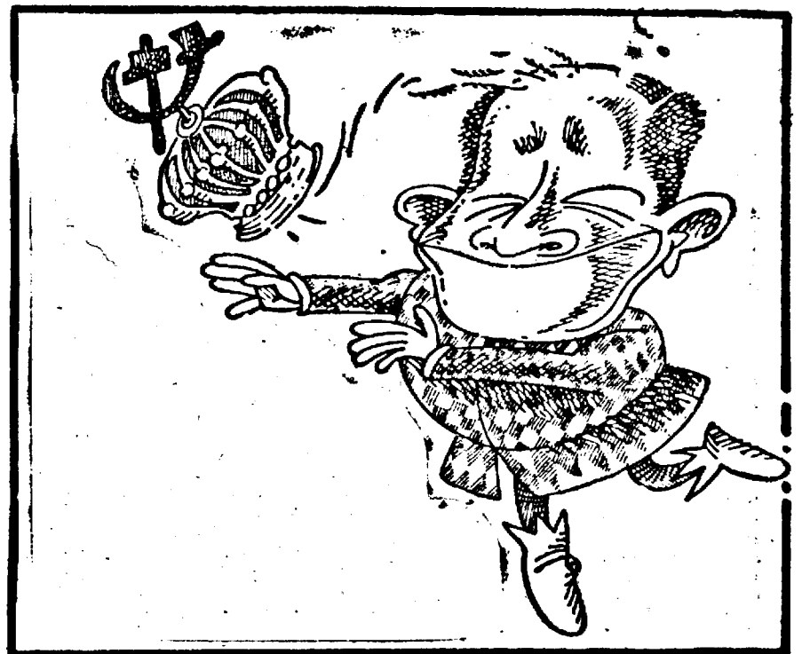
Caricatură de NIK LENGHER