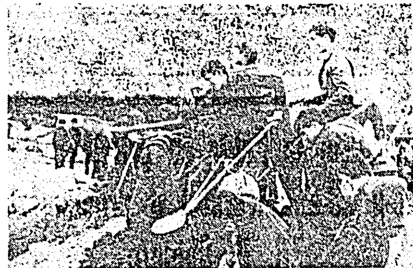
Elevi ai liceului „George Coșbuc” din orașul Nădlac la muncă patriotică.

au fost preluate în termenul prevăzut precum și la bucuriile din Călea Aurel Vlaicu. Pînă la sfîrșitul anului se vor mai da în folosință școala din Bujac, internatul și cantina școlii profesionale textile și, probabil, complexul cooperatist meșteșugăresc de pe strada Eminescu. În aceste zile constructorii zoresc lucrările la halele de la Uzina de fabricații, reparării și montaj în agricultură, au început un complex de construcții la Moneasa etc. Principalele probleme sînt însă îndreptate spre terminarea blocurilor de locuințe prevăzute pentru acest an. În mod obiectiv, darea de seamă va arăta că pînă la sfîrșitul primului semestru sarcinile economice ale șantierului au fost îndeplinite ritmic și chiar depășite în mod substanțial. A intervenit însă o perioadă destul de lungă cînd din cauza proastei aprovizionări cu ci-