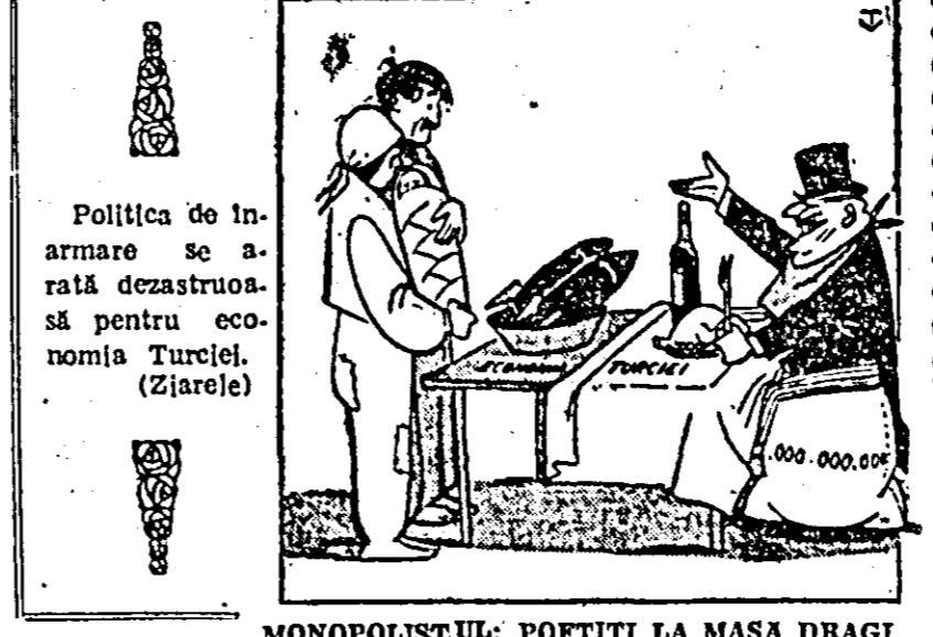
MONOPOLISTUL: POFTITI LA MASA DRAGI CONSTATATI: AJUNGE PENTRU TOTI... (Desen de V. TIMOC)

nului sovietic de la 21 pînă la 31 mai a.c. Data vizitei oficiale a lui Modibo Keita care a fost stabilită pentru perioada 15—25 mai a fost modificată în conformitate cu dorința manifestată de guvernul Mali.