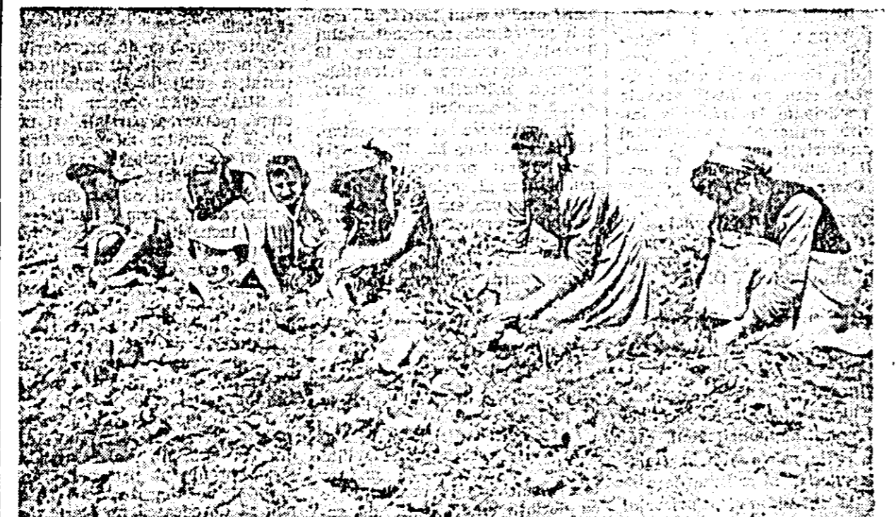
Colectiviștii din Turnu au început zilele acesteia plantatul roșiilor în câmp. În cliseu: un grup de colectiviști sădind roșiile.

În Capitală a început luni dimineața faza pe țară a Concursului național al tinerilor soliști, organizat de C.C. al U.T.M. și Ministerul Invățămîntului și Culturii, în întîmpinarea Festivalului mondial al tineretului și studenților care va avea loc la Helsinki. La această fază participă circa 200 de soliști vocali și instrumentiști, selecționați în etapele interregionale care s-au desfășurat la București, Cluj, Iași și Timișoara. În prima zi a fazei finale s-au întrecut concurenții de canto, de balet și de muzică populară. În zilele următoare se desfășoară în continuare concursul de canto, precum și cele de pian, instrumente de suflat și instrumente de coarde, concursul urmînd să se încheie în ziua de 10 mai.