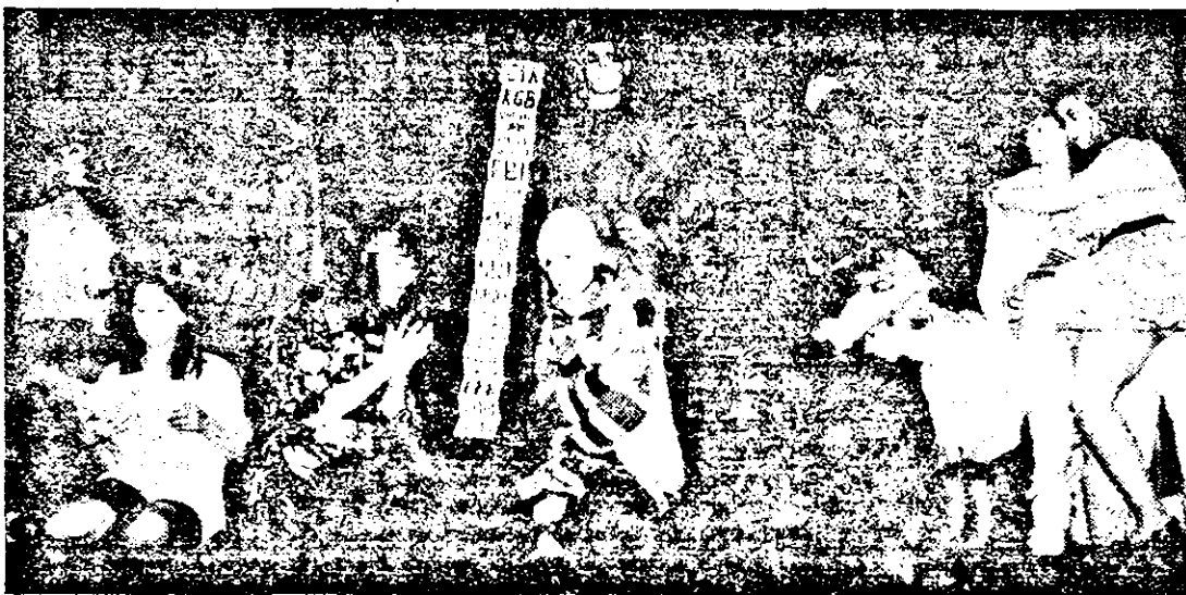
Secvență din spectacolul „Harap Alb”