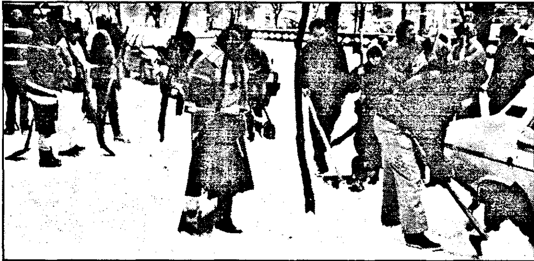
Imediat după ora 8,30 ieri, salariații Regiei de Salubritate (subordonată Primăriei) au luat cu asalt zăpada din fața Redacției „Adevărul”. Cuvântul de ordine: „Să vadă ziaristii că s-au luat măsuri pentru dezzăpezire!”. Și, am văzut. Dar bine ar fi ca acest lucru să se vadă și în celelalte colțuri ale orașului!