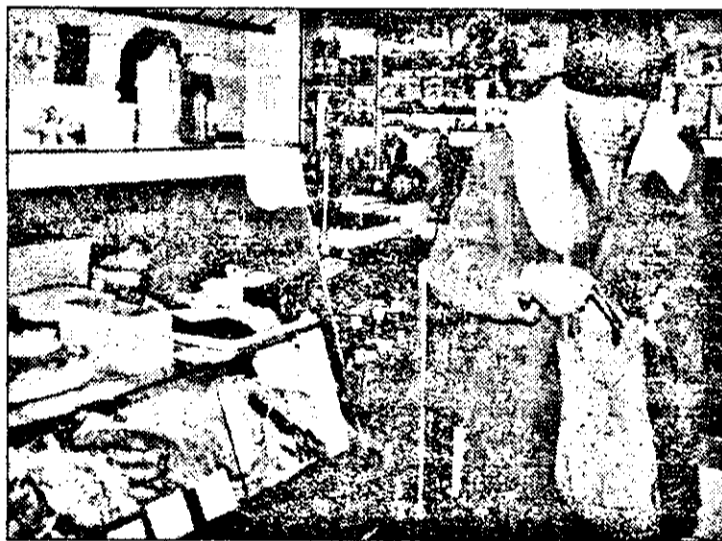
La magazinul de lactate de pe strada EMINESCU sunt de toate, mai puțin ceea ce scrie pe firmă. Adică, lactate. Zilnic, aici intră în magazin sute de clienți dorind să procure măcar un litru de lapte. Produsul însă continuă să lipsească fără a li se oferi o explicație credibilă. Unde-i oare laptele de altădată?