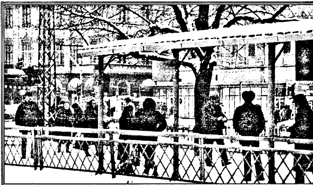
A fost ger, a nins... acum e bine, Dar tranvaiul tot nu vine !