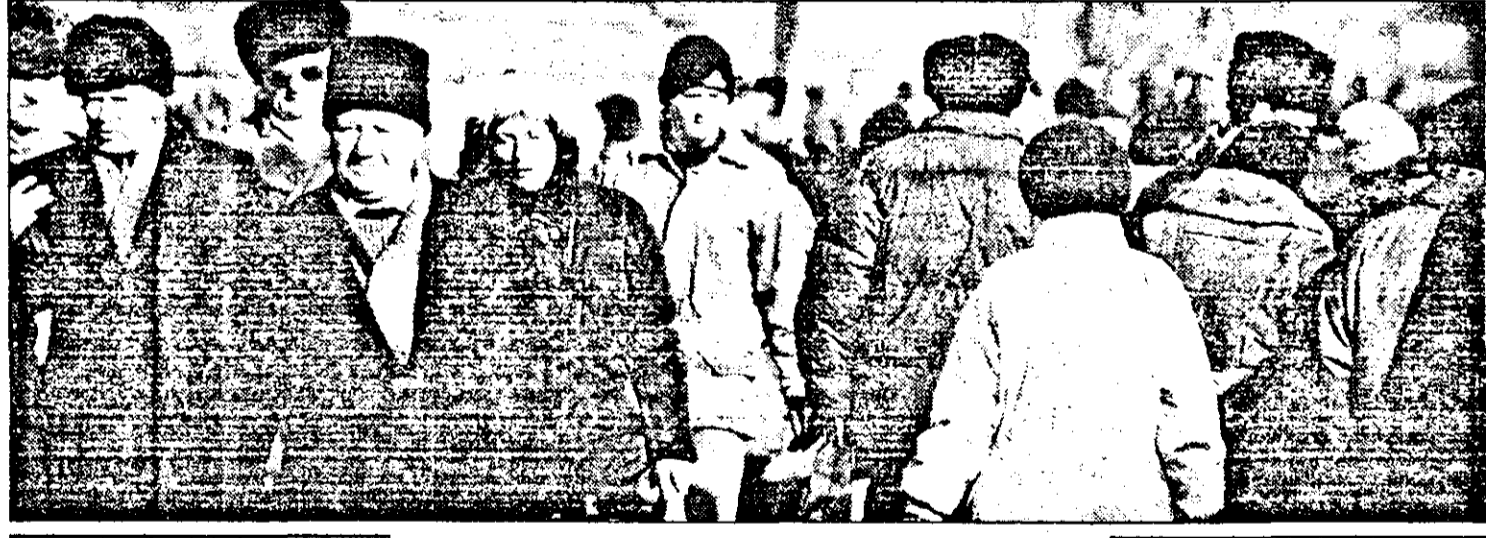
Așa să arate, oare, clasa de mijloc postrevoluționară românească?