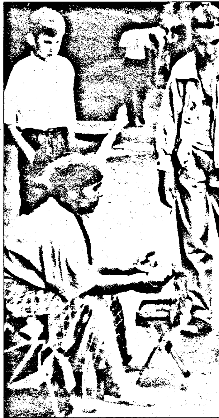
Vanzatoarea de noroc ... nu prea are clienți