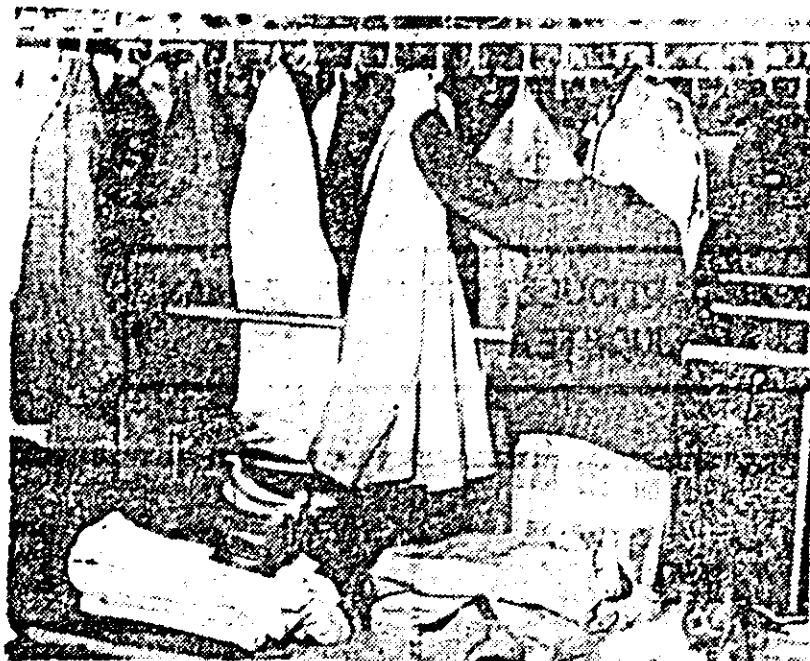
Sute de articole de îmbrăcăminte pentru cei sinistrați, se adună oră de oră la centrul de colectare de la clubul Tricolor Roșu.