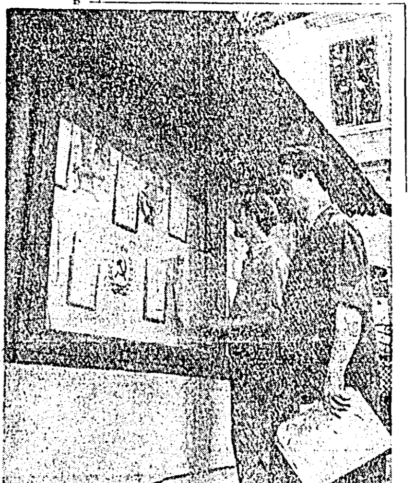
Gazeta de perete a organizaţiei de partid şi a comitetului sindical de la Întreprinderea „7 Noiembrie” publică cu regularitate articole despre munca şi preocupările muncitorilor, despre experienţa frunţaşilor în producţie şi este citită cu mult interes.

Preocupîndu-se pentru asigurarea de furaje în cantităţi cit mai mari, muncitorii gospodăriei de stat din Sînpetru German au însilozat pînă acum însemnate cantităţi de nutreţuri timpurii. Astfel, s-au însilozat 240 tone de seceră verde, iar de pe cele 30 hectare de mazăre furajeră s-au sîrîns 160 tone de furaje care la fel au fost însilozate.