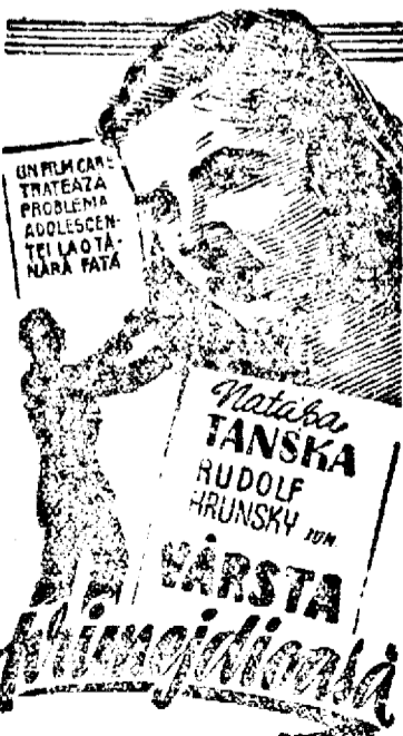
REGIA OTAKAR VAVRA