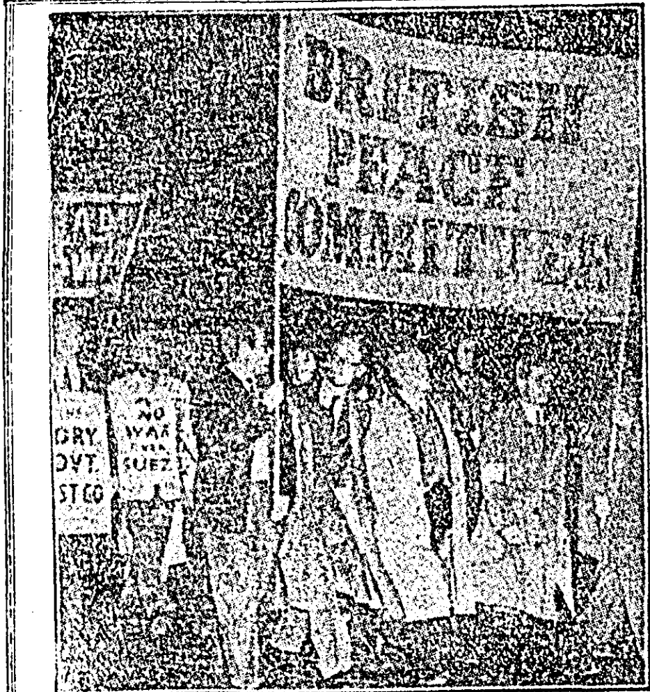
Comitetul britanic pentru pace a organizat această manifestație pe străzile Londrei pentru a protesta împotriva politicii războinice dusă de guvernul englez în problema Canalului de Suez.

★ La 25 septembrie, în statul Bengal de vest a fost declarată o grevă generală organizată de comitetul sindical de luptă împotriva creșterii prețurilor. Din comitet fac parte sindicatele afiliate la Congresul sindicatelor pe întregă India la organizația „Hind Mazdur Sahha”, la Congresul unit al sindicatelor și la o serie de alte centre. Comitetul cere să se ia măsuri împotriva creșterii prețurilor și pentru sporirea salariilor muncitorilor și funcționarilor.