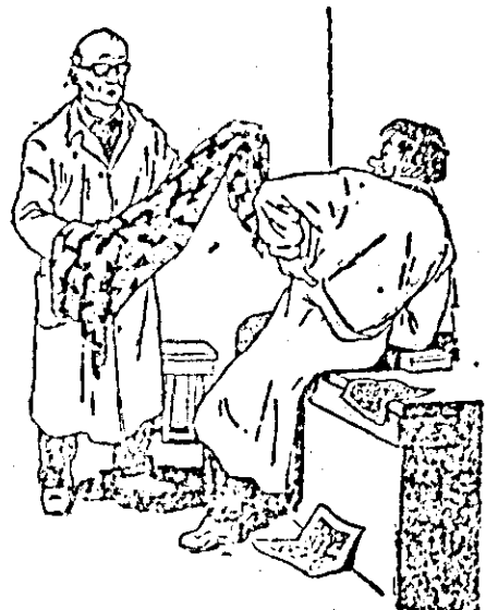
— Urst model au făcut — Nal grija: iese la spalalt