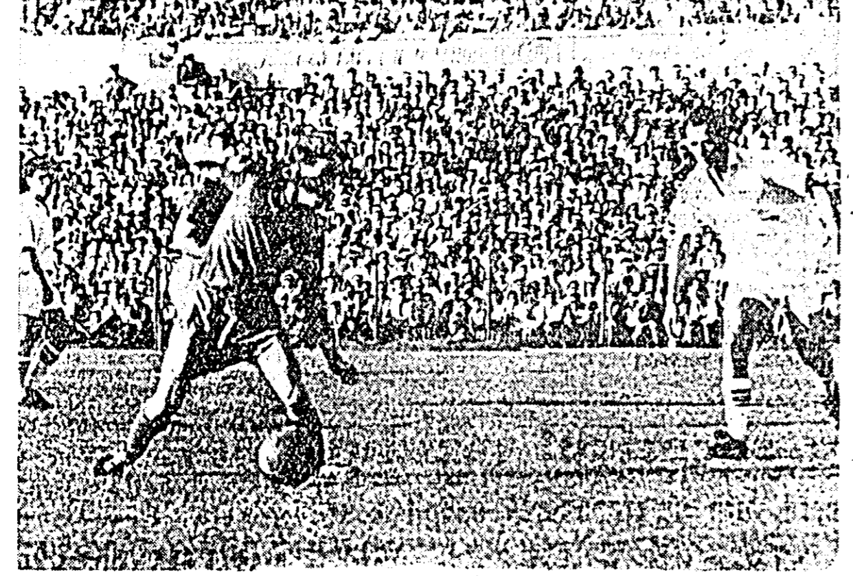
O fază din timpul meciului UTA-S. C. Aufbau

UTA, Pircălab, Kapas și Czako. I. REINHARDT - UTA: am fost mai bun. Meritam victoria și la acest scor. Dacă înalțașii noștri ar fi avut mai mult calm în lăza de finalizare a acțiunilor, scorul putea să fie și mai mare.