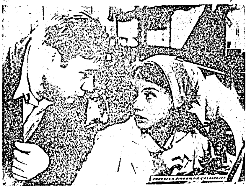
IN CLIȘEU: o secvență din film.

In săptămâna aceasta, pe ecranul cinematografului „N. Bălcescu” din Arad, rulează filmul „Povestea tinerilor căsătoriți”, o producție a studiourilor sovietice. Scenariul filmului, semnat de I. Hazin, aduce pe ecran o problemă de viață, foarte gîngășă prin specificul ei, problema tinerilor căsătoriți. Scoțind în evidență faptul că cele mai multe discuții într-o familie nouă pornesc de la gelozia neîntemeiată care generează nelăcredere, autorul scenariului, folosind câteva exemple concrete, scoate în relief rolul colectivului în consolidarea familiei, în aplanarea acestor conflicte. Filmul, a cărui regie este sem-