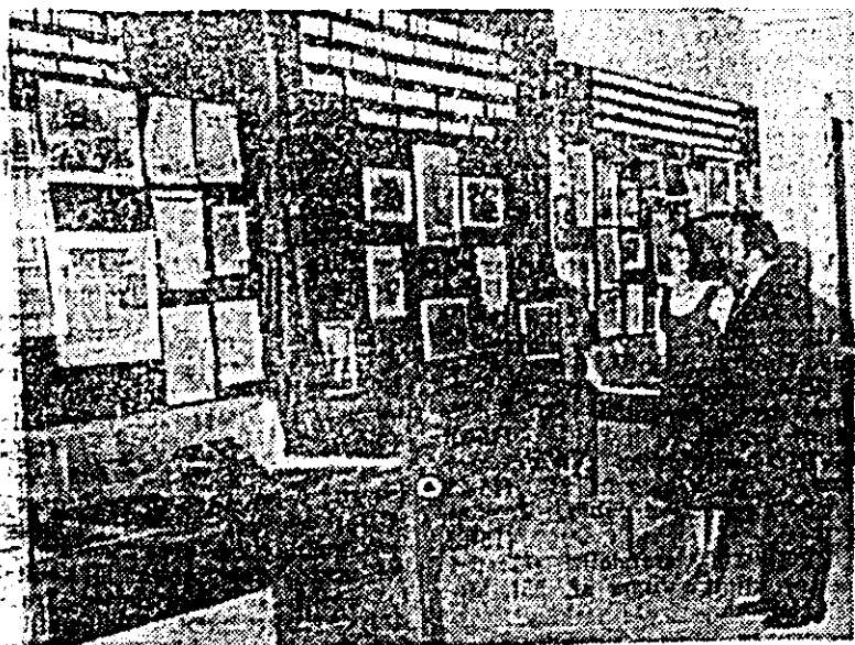
Aspect de la expoziția omagială „Drumul de luptă și jertfa al independenței și libertății poporului român” deschisă în aceste zile la Muzeul Județean din Arad.