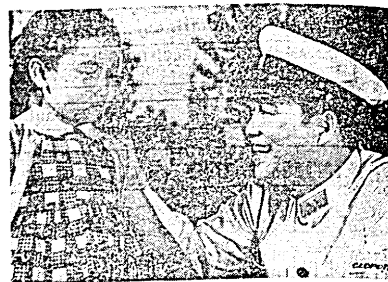
IN CLISEU: o scenă din film.

Clopotel este numele unei marionete de la teatrul de păpuşi, devenit eroul filmului realizat de studourile din R. P. Chineză.