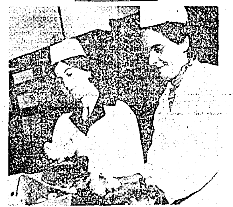
La stația de incubajie din orașul nou a Centrului de în-sămînțări artificiale a fost scoasă o nouă „sarjă” de pul.