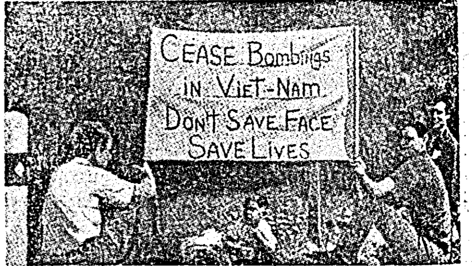
Studentii americani instalați în apropierea reședinței președintelui din Johnson-City au manifestat recent pentru încetarea agresiunii SUA în Vietnam.