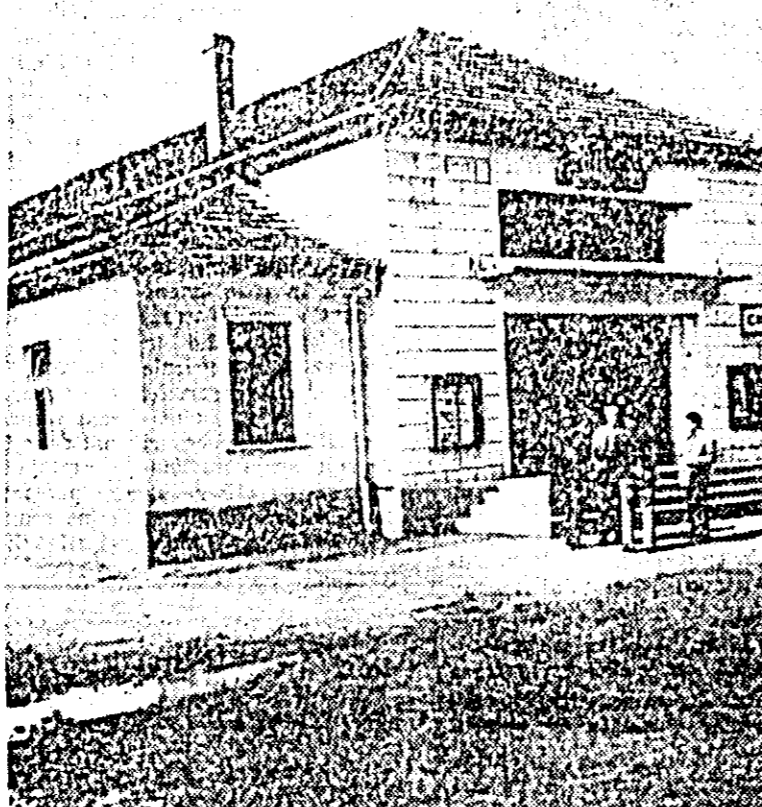
Unul din locurile îndrăgite de cetăţeni din Mîndruloc este căminul cultural (pe care îl vedeţi în fotografie).

A. D. ZAMFIRESCU — Dal-taban de Seraschler. Nuvele. Editura pentru literatură. 400 pag. 8 lei