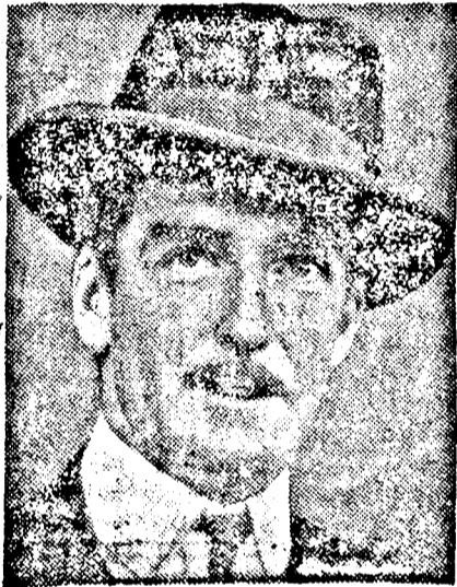
Sir ANTHONY EDEN, angol főpeccsétör

laszt ad. Nem kell a valóságot sötétebbnek látni, mint amilyen. A leszerelés meghiusulása esetén viszont minden országnak módosítania kellene a fegyverkezést. Ebből a szempontból Anglia jöhet elsősorban számításba, mert már