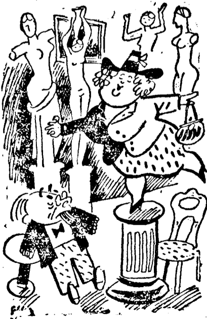
Körülbelül ebben a beállításban szeretném a szobrot...

Az állami nyugdíjasok vasúti igazolványainak kiadása. A CFR vezérigazgatósága rendeletet adott ki, amely szerint az állami nyugdíjasok új vasúti igazolványait a következő módon adják ki, vagy cserélik ki: A kérvényezőnek csatolnia kell a nyugdíjkönyvét, vagy egy bizonyítványt arról, hogy nyugdíjas. A bizonyítványt az a pénzügyigazgatóság állítja ki, ahonnan a nyugdíjas felveszi illetményét. Csatolni kell azt a vasúti igazolványt, amelyet a nyugdíjas aktív szolgálatlét idején használt és a rendőrségi bejelentő hivatal igazolványát a feleség és a 16 évnél idősebb gyermekek számára. Csatolni kell a házassági bizonyítványt, valamint a gyermekek születési bizonyítványát. A vasúti igazolványok rendszeres évi látványozásához a következő okmányok szükségesek: nyugdíjkönyv, vagy a pénzügyigazgatóság igazolása a nyugdíjas állapotáról, igazolvány arról, hogy a feleséggel való házasság még érvényben van (az asszony igazolványa számára), a rendőrség bejelentőhivatalának személyazonossági igazolványa a férfi, feleség és a 16 évnél idősebb gyermekek számára.