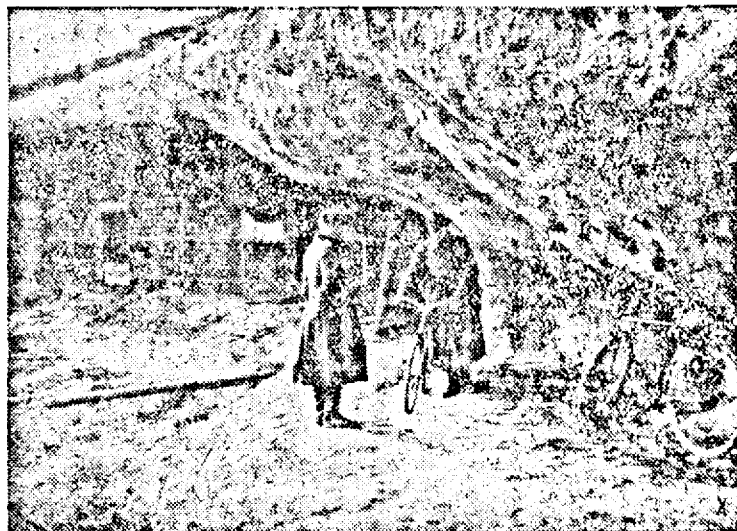
Postul de comandă al unui regiment german în munții Jalla. (PK Ob)

TIMIȘOARA, Str. Bolintineanu 7. ARAD, Bul. Regele Ferdinand 46.