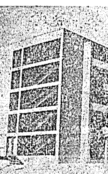
Noul complex studențesc din orașul Iași are 4 cămine cu 1600 locuri și o cantină la care servesc masa 2000 studenți.

La diferite lucrări miniere, atât în subteran cât și la suprafață, se folosesc în prezent materiale plastice. Un prim sector în care s-au introdus masele plastice, au fost uzinele de preparare a cărbunelui. Aci s-au aplicat conducte din policlorură de vinil cu diametri de 50-90 mm care s-au dovedit foarte rezistente la coroziune, chiar și în cazurile în care s-a transportat apă cu suspensii de cărbune mărunț, care are un accentuat efect abraziv.