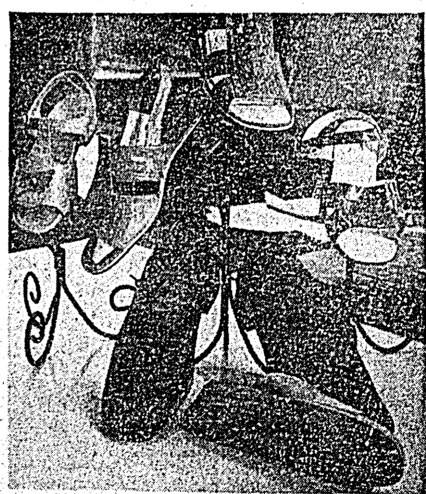
Cîteva din cele 350 de noi modele ale anului 1972 pe care le va pune la dispoziția cumpărătorilor fabrica de încălțăminte Libertatea.