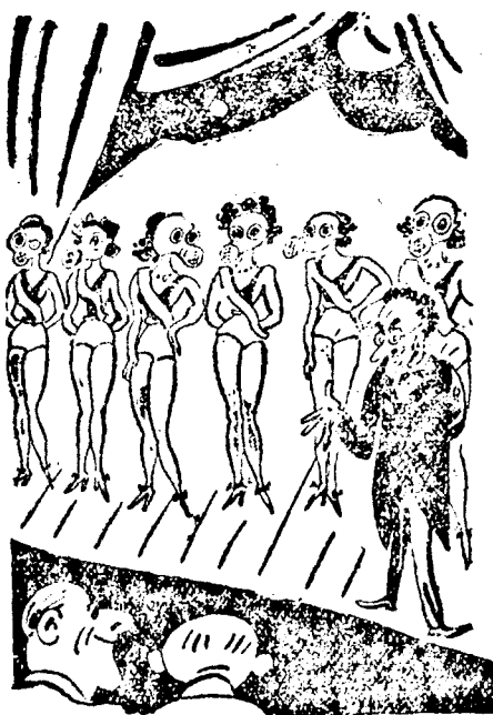
Szépségverseny a jövőben!