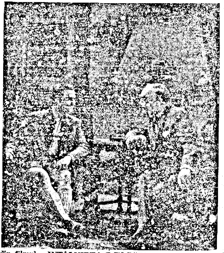
O scenă din filmul: „INTĂLNIREA DIN PADURE”, care rulează actualmente la cinematograful „CAPITOL”.

Un frumos succes obține, în timpul de față, pe ecranele germane „Carl Peters”, realizat de Hertha Feiler și interpretat de Hans Albers. Albers poartă aci — pentru prima dată în carieră — o respectabilă neagră.