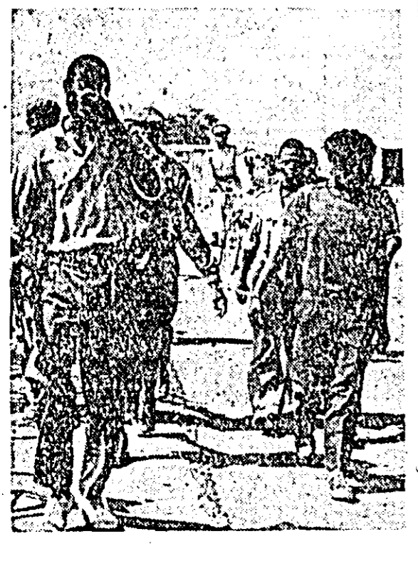
Acești negri din Republica Sud-Africană au căușe la mîini deoarece nu au avut asupra lor „pașapoarte” făcînd de care nu se pot deplasa dintr-un loc în altul...