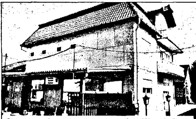
Casa unde s-au „ascuns” miliardele...

În urmă cu câteva zile relatăm în coloanele zîgrului nostru despre cea mai mare fraudă fiscală depistată în acest an de comisarii Gărzii Financiare. Era vorba de schrottul aparținând de S. C. „Las Vegas” SRL, la care comisarii Gărzii Financiare au depistat o serie de nereguli legate de modul de achiziționare a autoturismelor, în vederea dezmembrării și valorificării ulterioare a pieselor rezultate. După cum arătam la acel moment, acțiunea Gărzii