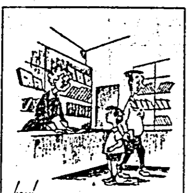
— Eu în locul lui aș prefera să rămîn fără caiete.

Responsabila Librăriei noastre nr. 3 din str. E. Varga nr. 1 are în general, o atîtitudine nepoliticoasă față de cumpărătorii.