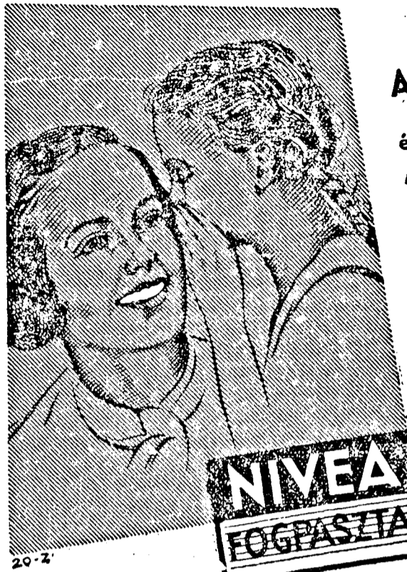
Habzó és nem habzó.

Most az amerikai rádióközönség millióit gyönyörködtették művészi zongorajátékukkal.