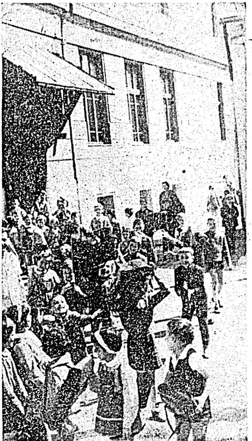
A sosește vacanța binemeritată.